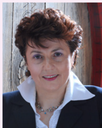
Gabriella Mazzucato di Monte Fasolo Cinto Euganeo

Info e prenotazioni: prenotazione obbligatoria (fino esaurimento posti disponibili) Cell. 328 4089272 - e-mail: info@viaggiarecuriosi.com